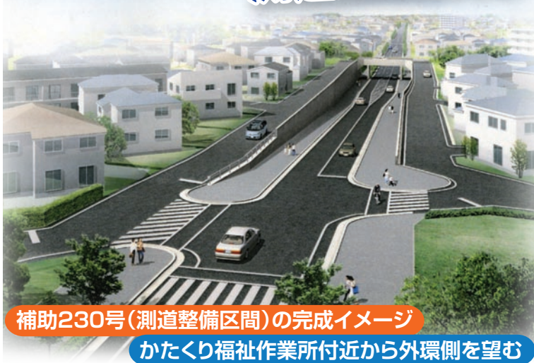
補助230号(測道整備区間)の完成イメージ