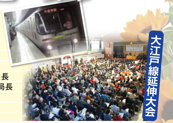
大江戸線延伸大会