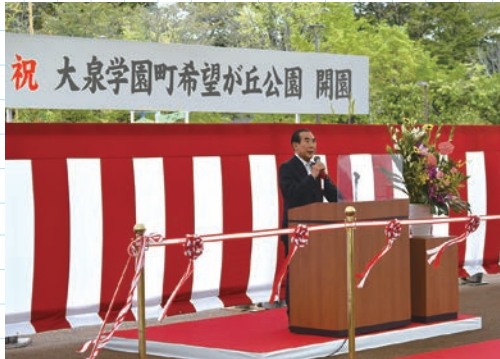
(議長として開園式祝辞)

旧大泉学園高校跡地を有効活用し整備を進めてきました。大泉町希望が丘公園ですが、関係者の皆さんの長年にわたるご尽力によりまして、第II期工事が完了し、平成23年度から既に第I期区域として利用開始している多目的運動場やテニスコートなど合わせ、約2ヘクタールの広大な公園として全面開園いたしました。また、公園整備では区立では初めてとなる300㎡の屋根付公園完成。防災倉庫を備えたこの公園が地域コミュニティの拠点となりますことを心から願っております。