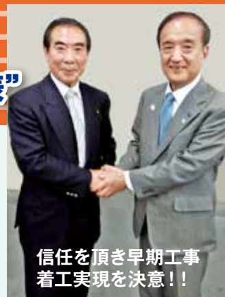
信任を頂き早期工事着工実現を決意！！

特に重要な地区と考えています。大泉学園地区まちの将来像を共有し、その実現に向けた手法や方策について話し合い、大泉学園地区まちづくり、駅前を含めた地区計画を進め、充実したまちづくりを進める。